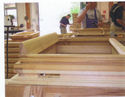
Die erhöhte Sprödigkeit der Belmadurkanteln erfordert Sorgfalt bei Handling und Verarbeitung