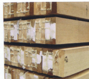
Kanteln mit Lamellen aus unbehandelter Kiefer und Belmadur

bläueanfällig, das Quellen und Schwinden wird reduziert. Die Sprödigkeit des Materials wird jedoch erhöht. Mit dem Belmadurverfahren behandelte Kiefer ist im Merkblatt HO.06-4 des VFF gelistet und zur Herstellung maßhaltiger Bauteile wie Fenster und Außentüren zugelassen. Die Vermarktung der Belmadurkanteln in Deutschland erfolgt exklusiv über die Münchinger GmbH & Co. KG.