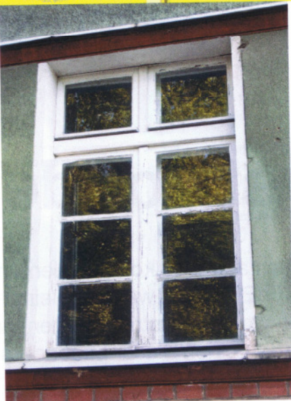
Das historische Vorbild ...

Für die Belmadur/Kiefer-Kanteln sprachen zwei wesentliche Aspekte: Zum einen ist der U-Wert des Rahmens um ca. 0,1 \text{ W/m}^2\text{K} besser als bei herkömmlicher Kiefer. Zum anderen konnte auf Tropenholz verzichtet werden, was den ökologischen Anforderungen der Auftraggeber Rechnung trug. Die Sprödigkeit der Belmadur/Kiefer-Kantel darf bei der Verarbeitung nicht unterschätzt werden. Während der Produktion und beim anschließenden Handling (Versand, Montage) ist Sorgfalt oberstes Gebot, grobschlächtiges Hantieren verzeiht die-