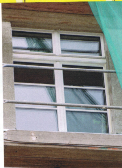
und das neue »Berliner Warmfenster«