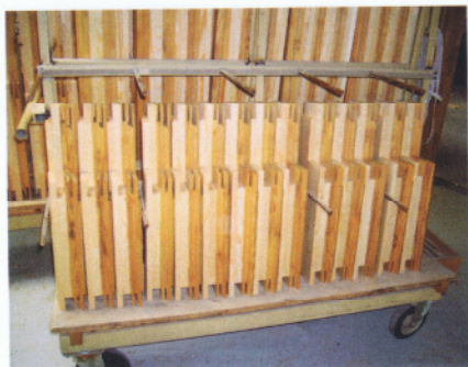
Die fertig bearbeiteten Belmadur-Fensterkanteln vor dem Verleimen

struktion durch die zuständige Denkmalbehörde Voraussetzung. Abweichend von einer in den meisten Holzfenstersystemen anzutreffenden Glasnackenschräge von 18^\circ wurde beim eingesetzten »Berliner Warmfenster« die Glasnackenschräge auf 35^\circ erhöht. Damit wird die in alten Kastenfenstern anzutreffende Kittfalzschräge aufgenommen;